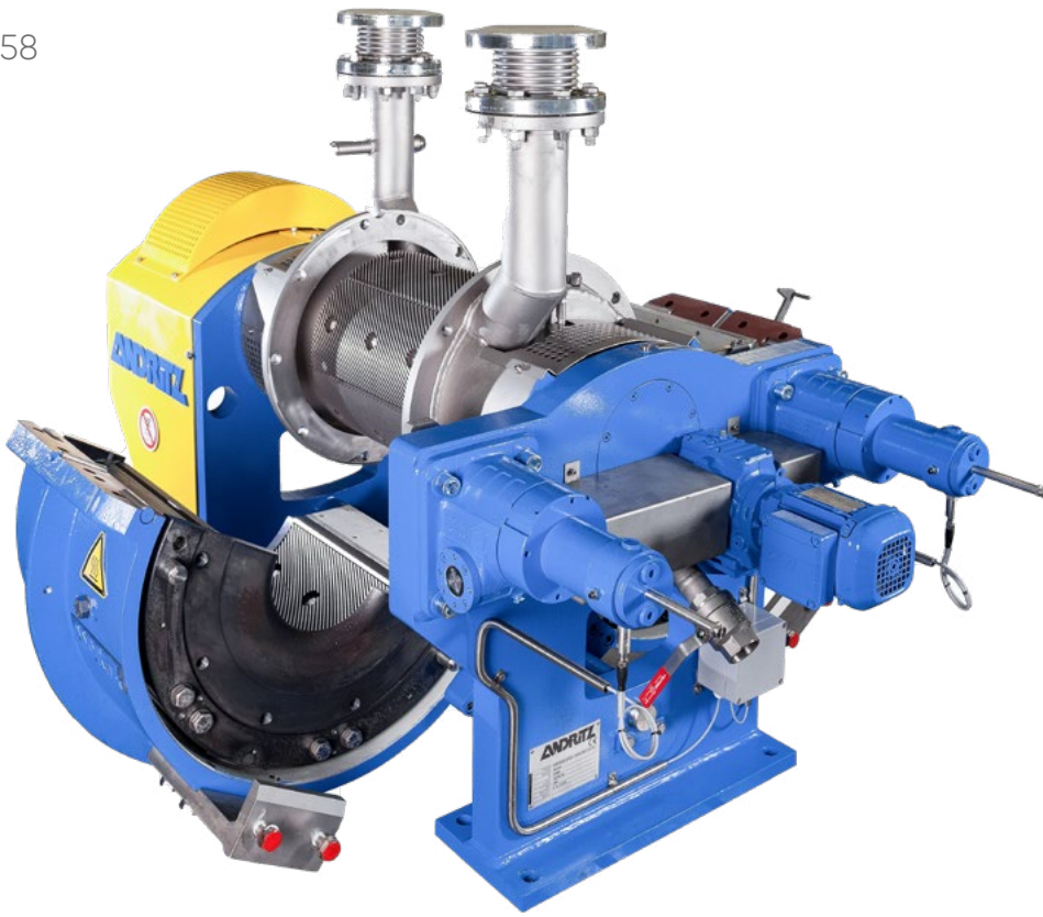
安德里茨紧凑转子设计的圆柱磨

机构。比如，最新设计的PrimeLineTEX塑纹型卫生纸机就是在该试验工厂完成研发和测试的。该纸机生产的优质塑纹型卫生纸的质量非常接近TAD。PrimeLineTEX塑纹型卫生纸机具有极大的灵活性，它能够在生产塑纹型或干法起皱型卫生纸的两种模式间灵活转变。